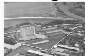
Býv. Poznaň, Žarnovica