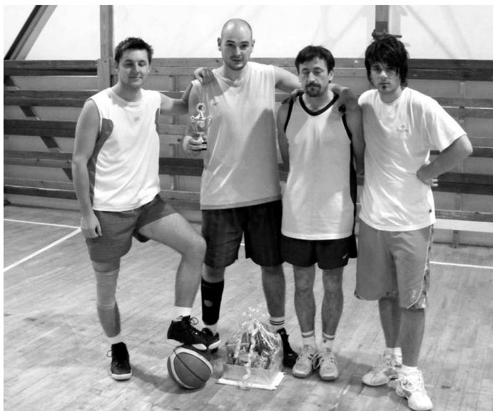
♦ Víťazné družstvo.