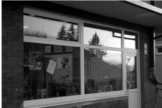
• Výmena vchodových zostáv a okien na Dome služieb.

na všeobecnú spokojnosť dobre. Tlačíme pred sebou zopár problémov, ako je napr. kúpalisko, Zvonička, zastaraný vozový park na TS, dopĺňanie z rozpočtu mesta na likvidáciu