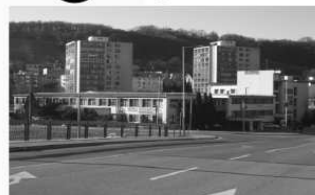
Býv. KVETA, Nová Baňa