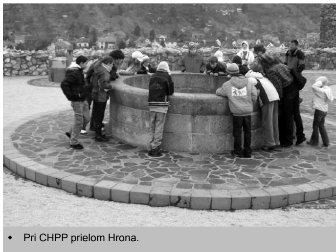
♦ Pri CHPP prielom Hrona.

Novembrové vlastivedno–turistické podujatie, ktoré pre svojich členov pripravila Územná správna rada DO FÉNIX v Novej Bani, zaviedlo účastníkov do Hronského Beňadiku a Levíc. Pokiaľ v Hronskom Beňadiku spoznávali históriu našej vzácnnej národnej kultúrnej pamiatky (NKP) – benediktínskeho kláštora a baziliky, v Leviciach ich čakal relax v krytej plavárni, ktorá na hodinu patrila len fénixákum. Cestou domov účastníkov čakala ešte krátka prechádzka časťou Slovenskej brány vedľa prielomu Hrona. Táto časť patrí z botanického, historického a pokiaľ ide o hradisko na Krivíne aj archeologického hľadiska k vzácnym lokalitám na Slovensku. Ďalšie kilometre autobusom patrili už tradičnej tombole, z ktorej si deti odniesli