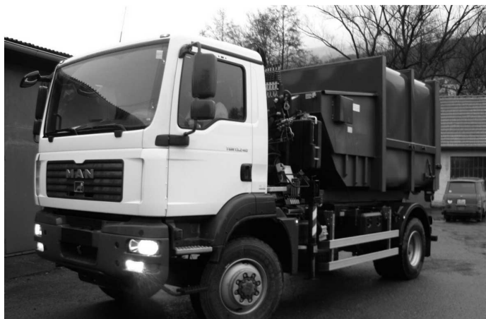
♦ Nákladný automobil na zber separovaného odpadu.