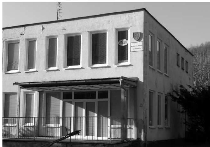
♦ Vymenená časť okien a dverí v MŠ Nábřežná.

Z plánovaných – rekonštrukcia sociálnych zariadení pri obradnej sieni, obnovenie nebytových