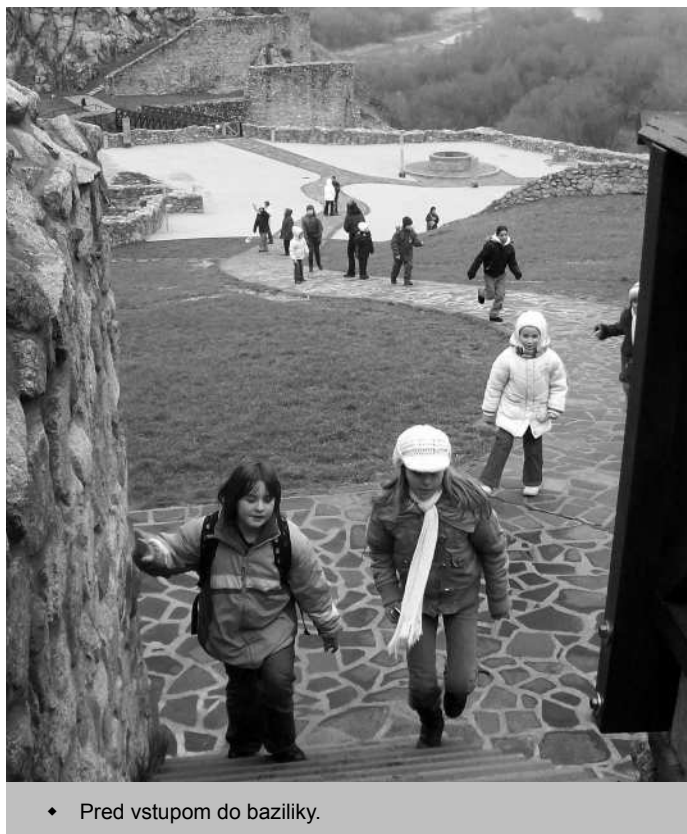
♦ Pred vstupom do baziliky.