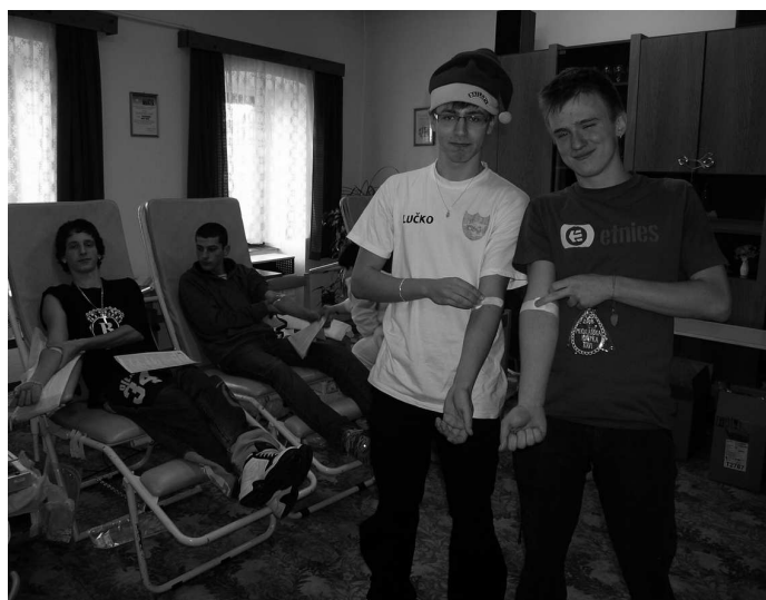
♦ Je potešiteľné, že Mikulášskej kvapky krvi sa zúčastnilo veľa prvodarcov, študentov Gymnázia F. Švantnera, ako aj Strednej odbornej školy v Novej Bani. Verme, že sa z nich stanú pravidelní dobrovoľní darcovia krvi.