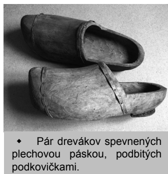
♦ Pár drevákov spevnených plechovou páskou, podbitých podkovičkami.

Dodnes živá tradícia spracovania dreva má v Novej Bani dávnu minulosť, ktorej korene môžeme hľadať v „drevenej kultúre“ – domáckej výrobe tunajších obyvateľov. Už v 15. storočí, keď v dôsledku prenikania spodnej vody do štólní baníctvo a tým pádom aj samotná Nová Baňa hospodársky upadala, hľadali baníci a remeselníci iné možnosti obživy. Ešte závažnejšou príčinou vzniku domáckej výroby bola diskriminácia mestskej chudoby, želiarov a obyvateľov okolitých osád, ktorí sa nesmeli zaoberať remeslom, obchodom, ba ani výrobou mlynských kameňov. Dominantné postavenie medzi im prístupnými zárobkovými možnosťami dostávalo práve spracovanie dreva v malom – po domácnostiach. Zhotovovali sa predovšetkým úžitkové predmety, potrebné na prípravu a konzumáciu jedla: varešky, lyžice, vahančeky, lopáre, maselnice, cedníky, lyžičníky, putne. Z poľnohospodárskeho náradia to boli napr. hrable, vidly, cepy... Typickým dreveným výrobkom pre túto oblasť boli aj šindle. Ojedinele sa objavujú i umelecké predmety – sakrálna plastika, vyrezávaný nábytok, figurálne úle či hudobné nástroje. Využívané boli rôzne druhy dreva, dub, smrek, lipa, lieska, čerešňa,