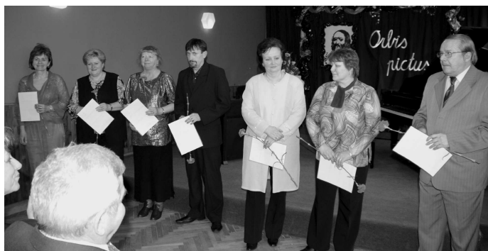
♦ Ocenení riaditelia škôl.

Na úvod si kyticu básní pripravili deti z MŠ Kalvárska a prváčka ZŠ Jána Zemana. Oceneným