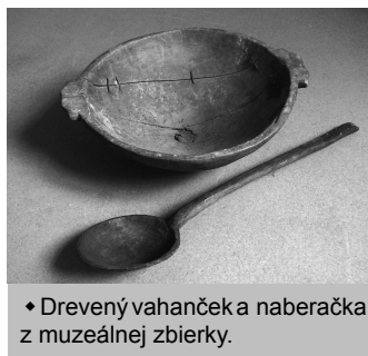
♦ Drevený vahanček a naberáčka z muzeálnej zbierky.

Z archívnych prameňov sa dozvedáme, že šindľov sa ročne