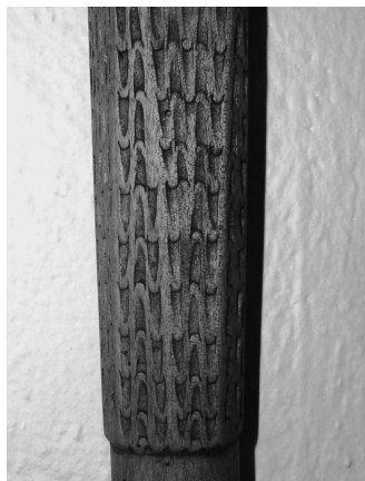
♦ Detail zdobeného kosiska.