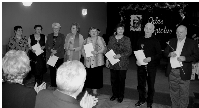
♦ Ocenení učители - dôchodcovia.