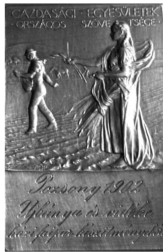
♦ Ocenenie domáceho spracovania dreva v Novej Bani a v okolí z roku 1902.

vyprodukovalo niekoľko tisíc kusov, preto v roku 1767 vydal banksý majster nariadenie, podľa ktorého šindliari smeli vyrábať len pre mesto a erár. Domácka výroba vykazovala v tomto období značnú produkciu a odbyť, napr. v roku 1772 sa vyviezlo na Dolniaky 60 - 70 vozov, naložených viničnými kolíkmi. Keďže výrobcovia boli upodozrievaní, že vyrábali z nakradnutého dreva, označil ich banksý majster s hnevom ako „črvotoč“ (Holzwurmen). Spotrebu ukradnutého dreva odhadol na 400 - 500 siah a podľa neho z toho ani erár, ani mesto nemalo žiaden ošoh. Zápis z 30. júla 1775 uvádza, že obyvatelia zo Starej Huty obchodovali s dreveným riadom nielen v okolí Novej Bane, ale aj v rôznych častiach Uhorska. Snaha banksého majstra obmedziť produkciu a predaj iba na novobanský trh nebola úspešná, až napokon zostala jediná možnosť – prideliť Starohuťanom potrebné drevo. Na naliehanie mestskej rady im prideloval ročne 6 ks jedlí zo zimných kalamít. Podľa zápisu z roku 1776 vyrábalo 76 domácností drevené korýtka na chlieb. Tieto vozili do Pešti, Budína, Vacova, Komárna, Rábu a ďalších miest. Keďže tovar vozili na vozoch ťahaných tromi až