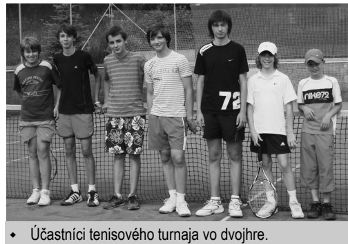
♦ Účastníci tenisového turnaja vo dvojhre.