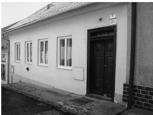
♦ Rodný dom básnika na Ulici Andreja Kmeťa.

Ešte ani nie 18-ročný Kornel musel 15. júla 1915 narukovať do ostrihomského 26. c. k. pešieho pluku a o pol roka nato bol odvelený na front. 4. augusta 1916 padol do zajatia v Rusku a 5 rokov prežil na Sibíri a v Turkménsku. V roku 1918 bol odviečený do Krasnojarska, kde sa stretol