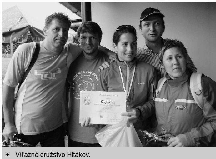
♦ Víťazné družstvo Hltákov.

T e š í nás, že pribudli noví organizátori, nové športy a hlavne z á u j e m m a ľ ý c h aj veľkých hýbať sa, súťažiť, športovať. (pokračovanie na str. 7)