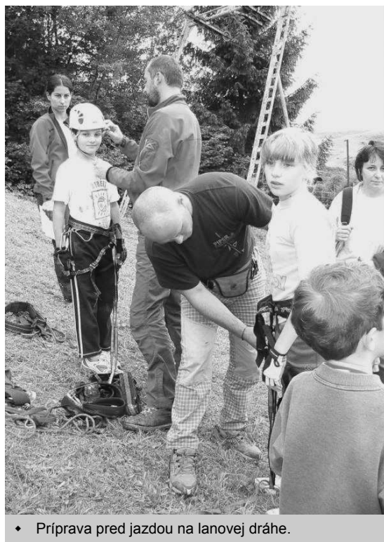
♦ Príprava pred jazdou na lanovej dráhe.