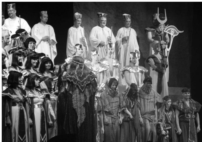
• Študenti gymnázia medzi zboristami na javisku.