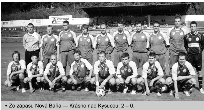
♦ Zo zápasu Nová Baňa — Krásno nad Kysucou: 2 – 0.

V prvých augustových dňoch sa rozbehli majstrovské futbalové súťaže riadené Stredoslovenským futbalovým zväzom. O súťažné body v novom ročníku 2009/2010 sa postupne zapojilo aj sedem súťažných družstiev nášho MFK. Muži podľa umiestnenia z predchádzajúceho ročníka budú aj naďalej hrať III. ligu, ako aj starší a mladší dorastenci. K výraznejším zmenám došlo v organizácii žiackych kategórií. Žiaci si vybojovali postup do I. žiackej ligy, ktorá je v podstate novoorganizovaná súťaž. V nej opäť budú dve vekové kategórie — starší a mladší žiaci. Rozdiel oproti predchádzajúcej súťaži bude v tom, že v tom istom hracom dni nebudú hrať niekdajšie dvojčky starší a mladší žiaci, ale dvojčky zložené zo starších a mladších žiakov toho istého klubu pod názvom napr. Nová Baňa A a Nová Baňa B v oboch kategóriách. Budú tam štartovať