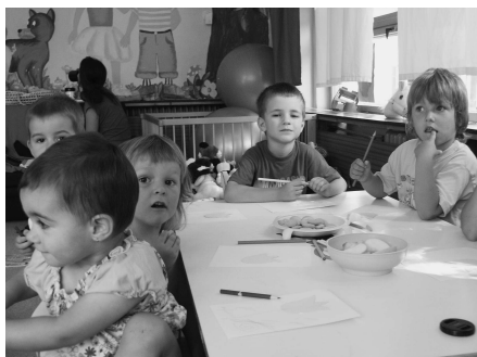
• Z programu Hráme sa na farby.