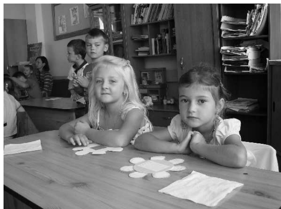
♦ Prváci v školských laviciach.