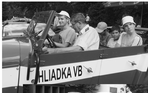
• Oddych na Duchonke.