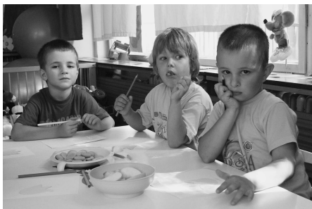
• Z programu Hráme sa na farby.

V auguste sme realizovali projekt, ktorý podporil Banskobystrický samosprávny kraj – do nášho Detského sveta pribudol altánok, smetné koše a lavičky. Vnútri sme kompletne rekonštruovali jednu herňu, vymenili sme koberec a z prostriedkov,