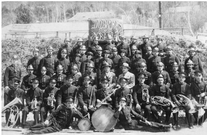
♦ Skupinová fotografia členov Dobrovoľného hasičského zboru aj dychovkou v roku 1931 — rok pred jej rozpadom.