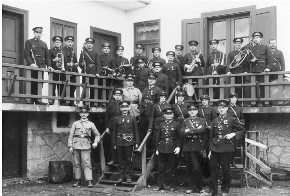
♦ Veliteľstvo, ženský samaritánsky oddiel a dychová hudba Dobrovoľného hasičského zboru v roku 1930.

Okrem školy bol v tom období hasičský spolok jediným nositeľom kultúrno-osvetovej činnosti v meste.