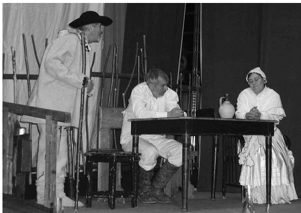
♦ Divadelné predstavenie od F. Urbánka PANI RICHTÁRKA.