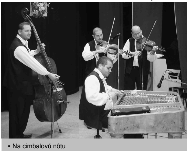
♦ Na cimbalovú nótu.