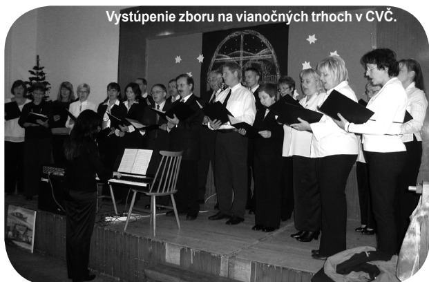
Vystúpenie zboru na vianočných trhoch v CVČ.

Svoju prvú „koncertnú šnúru“ sme otvorili vystúpením na vianočných trhoch a po ňom akoby sa roztrhlo vrece s rôznymi príležitosťami. Keďže koncertovanie pred publikom predstavovalo pre mnohých spevákov novú skúsenosť, považovala som za rozumné ju