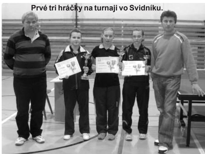
Prvé tri hráčky na turnaji vo Svidníku.