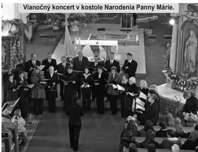
Vianočný koncert v kostole Narodenia Panny Márie.

Čo ťa ako dirigentku na koncertoch príjemne prekvapilo?