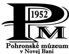
Pohronské múzeum v Novej Bani