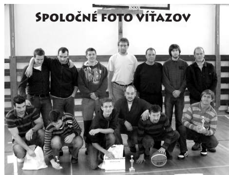
SPOLOČNÉ FOTO VÍTAZOV

Športový klub POOLO – Basketbalový oddiel usporiadal dňa 18.12.2010 tretí ročník turnaja pod deravými košmi. Priaznivci dynamickej hry sa zišli v telocvični ZŠ J. Zemana, kde si zmerali svoje sily a ukázali šikovnosť a cit pre hru.