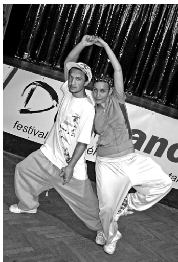
Vítazi krajského kola v Žiari nad Hronom