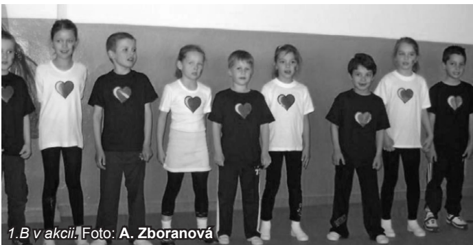
1.B v akcii.