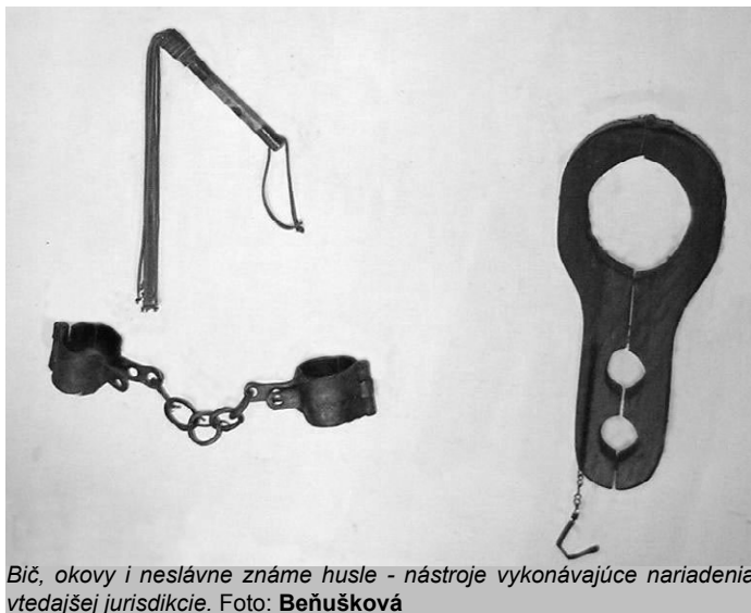
Bič, okovy i neslávne známe husle - nástroje vykonávajúce nariadenia vtedajšej jurisdikcie.

Najhorším typom fyzického násillia bola vražda. Napriek tomu, že sa takéto prípady medzi obyvateľmi v Novej Bani nevyskytovali až tak