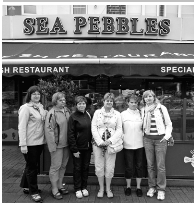
Typická anglická reštaurácia

Odbornej stáže v Londýne sa zúčastnili aj tri majsterky odborného výcviku SOŠ obchodu a služieb v Novej Bani. Okrem zaujímavých informácií o cestovnom ruchu, o vzdelávacom systéme mládeže v Anglicku a vzácných kultúrnych pamiatkach Londýna sme sledovali aj tradičnú anglickú kuchyňu. Súčasťou