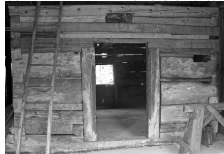
Drevená komôrka, v ktorej Hašek býval počas svojich návštev Novej Bane