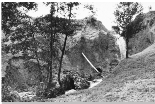
Pretrhnutá hrádza na Tajchu

Novobanská vodná nádrž – Tajch sa začala stavať v roku 1792 pre potreby vtedajšieho baníctva, keďže mechanizmy používané pri ťažbe potrebovali ako hlavnú pohonnú silu vodu. Stavbu realizovala Dvorská komora,