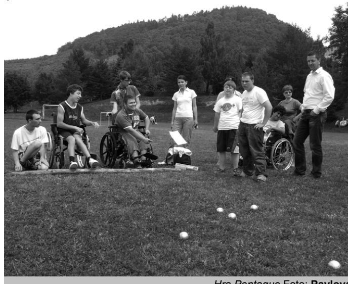
Hra Pentague