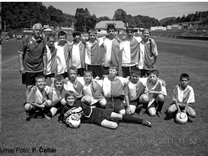
Z týchto dvoch družstev MFK bol uskutočnený výber na medzinárodný turnaj