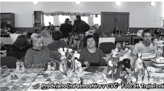
Predvianočná atmosféra v CVČ

Pod týmto názvom dňa 15. decembra 2011 sa v Centre voľného času v Novej Bani uskutočnilo podujatie, ktoré už niekoľko rokov pripravuje oddelenie kultúry a informácií.