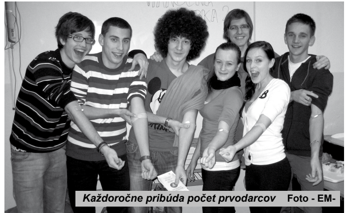
Každoročne pribúda počet prvodarcov

ZUŠ v Novej Bani sa 12. 12.2011 zmenila na školu života a ľudskosti. Túto myšlienku mi úplne spontánne vnukla skupina mladých ľudí- maturantov zo SOŠ obchodu a služieb a GFŠ v Novej Bani. Za niekoľko dní ich čaká maturitá-skúška dospelosti, a môžem povedať, že tú skutočnú skúšku majú stotočne za sebou. Nedalo sa nepristaviť pri týchto mladých, veselých študentoch a nepoložiť im niekoľko otázok, veď väčšina z nich prišla darovať krv prvýkrát. Prví sa zverili študenti GFŠ.