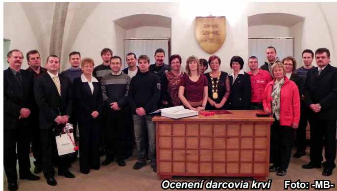
Ocenení darcovia krvi

V obradnej sieni mesta Nová Baňa boli v piatok 2. decembra prijatí darcovia krvi a zároveň prevzali plakety doktora Jánského a Kňazovického. Toto milé stretnutie Mesto Nová Baňa zorganizovalo za spolupráce Slovenského červeného kríža, územného spolku v Žiari nad Hronom. Všetci si vypočuli krátky kultúrny program a zapísali sa do pamätnej knihy nášho mesta.