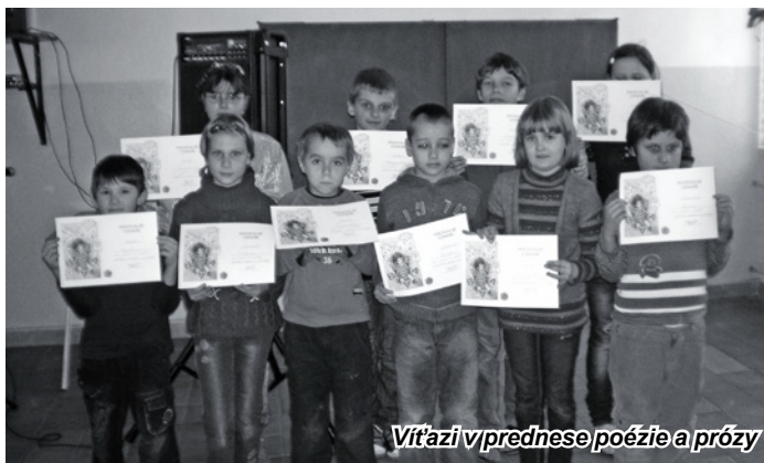
Vítazi v prednese poézie a prózy