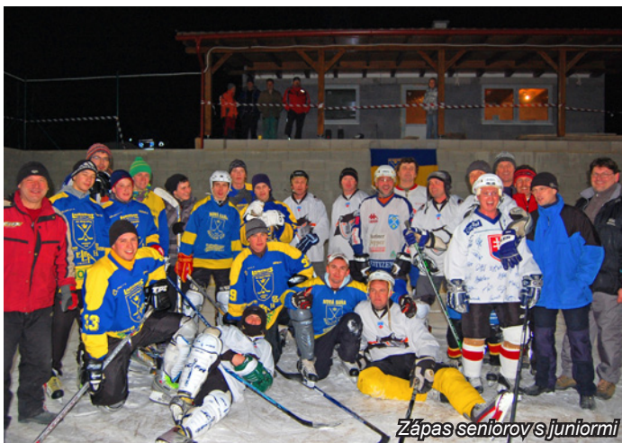
Zápas seniorov s juniormi