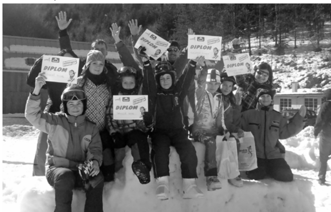
Družstvo SKI TEAM Nová Baňa po pretekoch na Salamandre