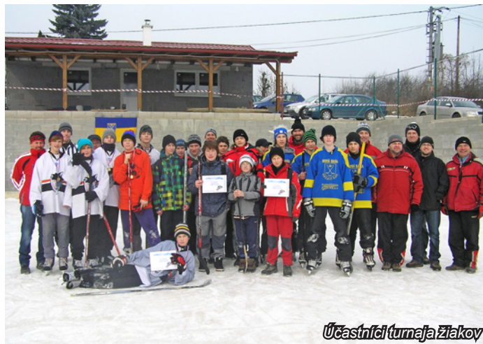
Účastníci turnaja žiakov