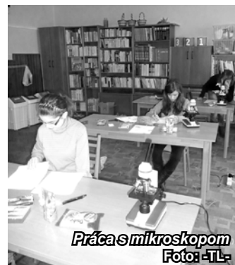
Práca s mikroskopom