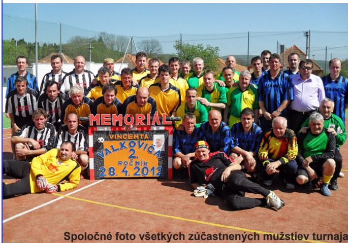
Spoločné foto všetkých zúčastnených mužstiev turnaja

Poslednú aprílovú sobotu sa v Tekovských Nemciach uskutočnil 2. ročník Memoriálu Vincenta Valkoviča. Na futbalovom podujatí, už s významnou tradíciou, sa predstavilo kvarteto kolektívov zo štyroch krajov Slovenska. Prešovský kraj reprezentovala Litmanová, Žilinský kraj zastupovalo mužstvo z Hôrok, Banskobystrický kraj reprezentovali internacionáli z Novej Bane a Nitriansky kraj zastupovali domáci futbalisti.