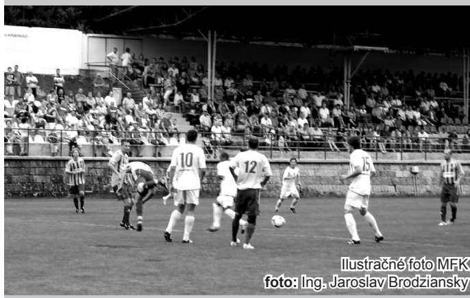
Ilustračné foto MFK