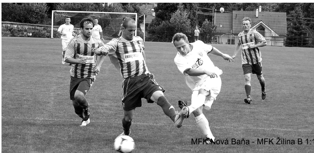
MFK Nová Baňa - MFK Žilina B 1:1

Prvý augustový týždeň sa rozbehli futbalové súťaže Stredoslovenského futbalového zväzu ročníka 2012 - 2013. V tomto ročníku budú aj naďalej štartovať v súťažiach družstvá MFK Nová Baňa. Mužstvo dospelých bude účinkovať v Majstrovstvách regiónu STRED dospelých, družstvá mladších a starších dorastencov v III. lige, družstvá starších a mladších žiakov v II. lige. Tieto družstvá dopĺňajú družstvá najmladších futbalových nádejí označované ako prípravka žiakov a „škôlka futbalu.“