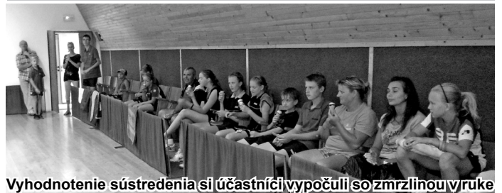
Vyhodnotenie sústreďenia si účastníci vypočuli so zmrzlinou v ruke