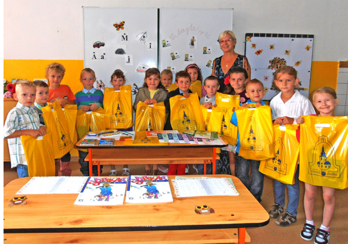
Na fotografii prváci 1.C triedy ZŠ Jána Zemana s tr. učiteľkou

„Každý deň sa niečo začína a niečo končí...“