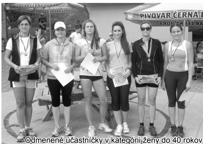
Odmenené účastníčky v kategórii ženy do 40 rokov