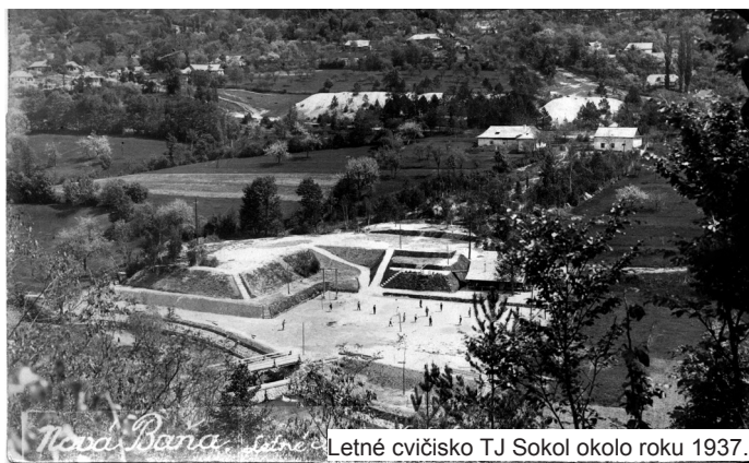
Letné cvičisko TJ Sokol okolo roku 1937.

roku 1924 už len 54 členov, v roku 1929 57 členov, v roku 1933 72 a v roku 1935 celkovo až 106 členov. Do roku 1929 bol členský poplatok jednotný vo výške 30 Kč. Od roku 1930 sa však odstupňoval na 24, 30, 40 a 60 Kč a od roku 1932 na 24, 35 a 45 Kč. V roku 1936 bola jeho výška 13 Kč, pričom vojaci platili 2 Kč, dorast 1 Kč a žiaci 60 halierov. Na čele TJ bol starosta, za ktorým nasledovali ďalšie, na valných zhromaždeniach zvolené funkcie, ako tajomník, jednatel, pokladník, zdravotník, hospodárski a účtovní dozorcovia... Jednoty tiež mali svojho okrskového a župného „vzdelávateľa“. Členovia jednoty