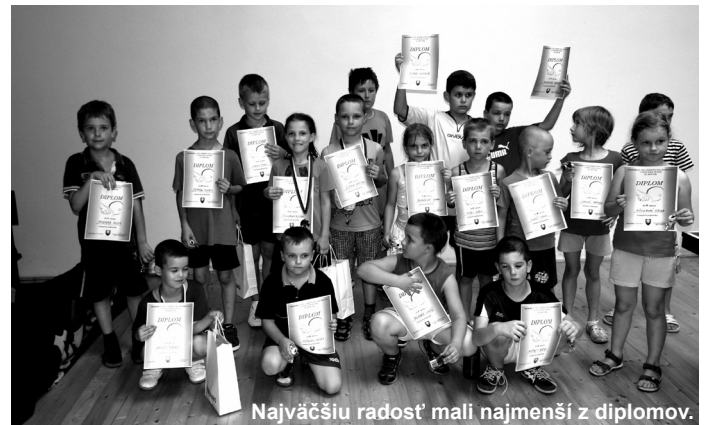
Najväčšiu radosť mali najmenší z diplomov.