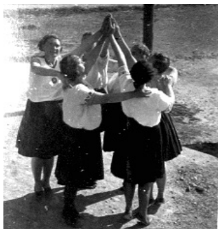
Členky ženského oddielu TJ Sokol v slávnostných krojoch pri predvádzaní cvičení zostáv v roku 1938; zdroj: zbierkový fond Pohronského múzea.