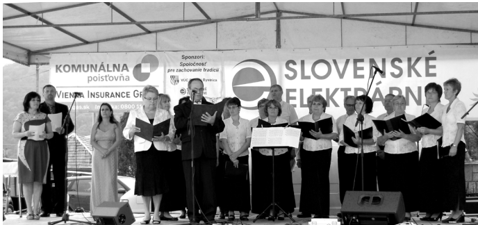
Spevácky súbor Žarnov vystúpil s pásmom k 1150. výročiu príchodu vierozvestcov na Veľkú Moravu.