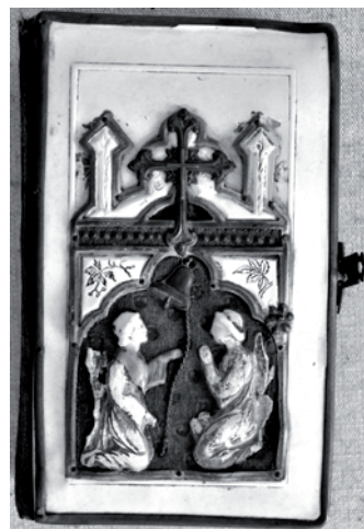
Modlitebná knižka z roku 1901 zo zbierok Pohronského múzea

Novobančania mali preukazovať vzájomnú lásku a súdržnosť nielen tunajším, ale tiež cudzincom. Jedným z nemalých prejavov lásky k bližnému napríklad bolo, že dovolili v meste pochovávať cudzincov, čo naozaj v danej dobe