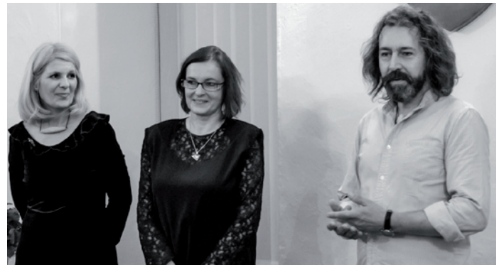
„Pätnástich rokov a prežili sme toho už veľa,“ priznáva tajomstvo spoločného úspechu umelec.

V umení musí byť isté napätie. Diela manželov poskytujú pohľad na ideálne spojenie mužského a ženského princípu, ktoré sa navzájom dopĺňajú a ovplyvňujú. „Veľa takýchto dvojíc sa rozháda, rozvedie. My si občas poviem, že ideme do niečoho spokne, a tak veľakrát potiahneme aj jeden za druhého. Vieme sa zastúpiť, vieme si oddýchnuť, vieme to vykryť. Konflikty nenastávajú, lebo to by tam bolo cítiť. My sa poznáme od