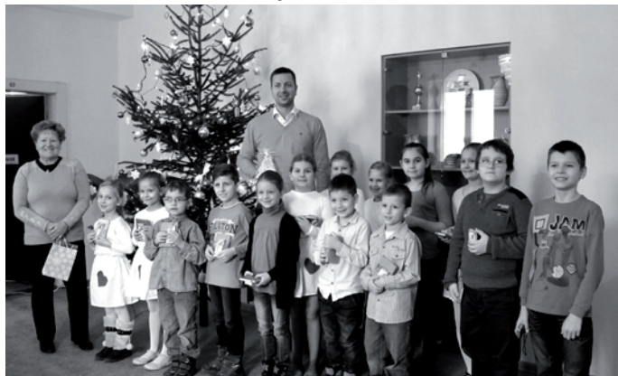
Vianoce, dieťa moje, to je čaro lásky.

Zakaždým, keď milujeme, zakaždým, keď dávame, sú Vianoce.