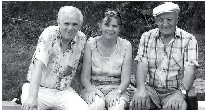
Na fotografii s bratom (vľavo) a s manželom (vpravo)