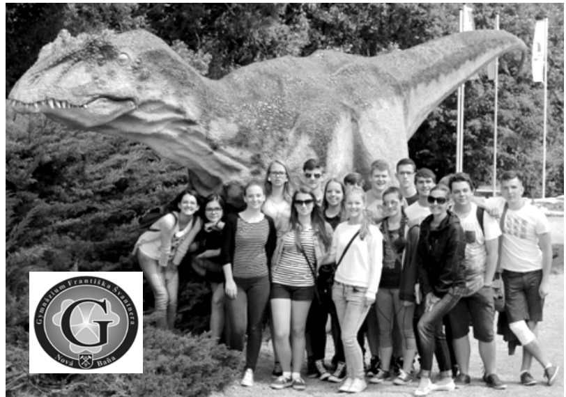
žiaci kvinty GFŠ