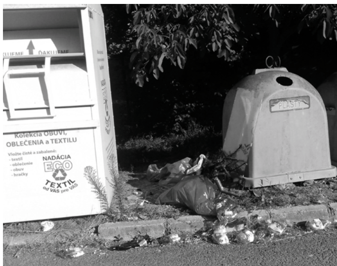
(3 hod. po uprataní priestorov na triedený odpad na ulici Mieru ...)