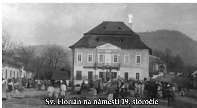
Sv. Florián na námestí 19. storočia

Pohronské múzeum Nová Baňa Internet Ministerstvo vnútra SR