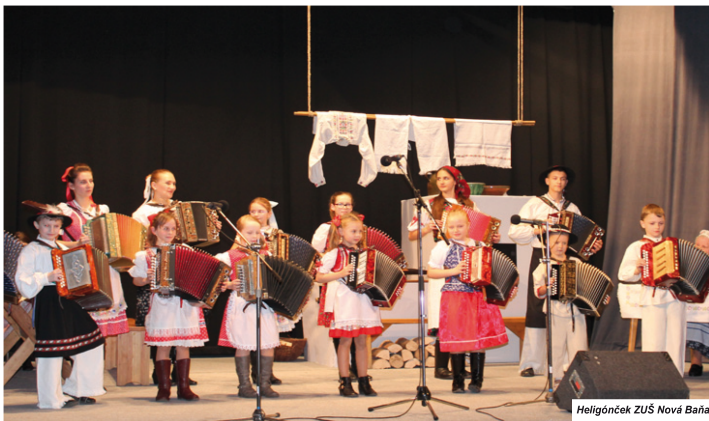
Heligónček ZUŠ Nová Baňa