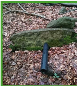
Hrašková studnička, N43 26 53.33607, E18 39 20.51337