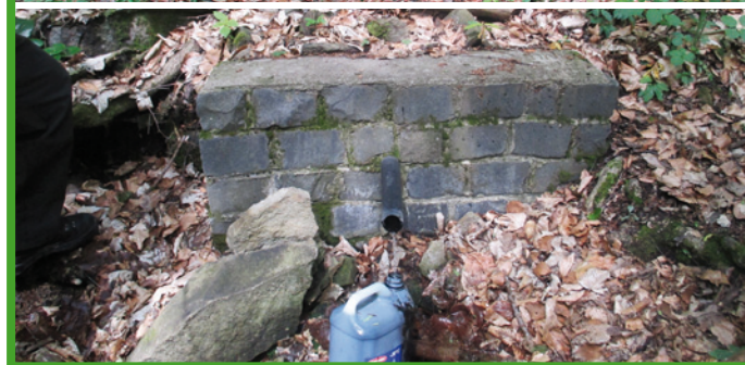
Zbojnícke studničky, N43 27 10.49555, E18 40 13.78246

Podieľ sa o svoju predstavivosť a pomôž pri rozvoji cestovného ruchu vo svojom meste!