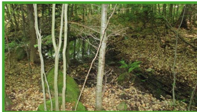
Lipinská studnička, N43 27 11.50495, E18 39 26.23282