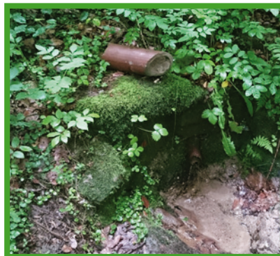
Rovienska, N43 26 15.16192, E18 38 52.18580

Podieľ sa o svoju predstavivosť a pomôž pri rozvoji cestovného ruchu vo svojom meste!