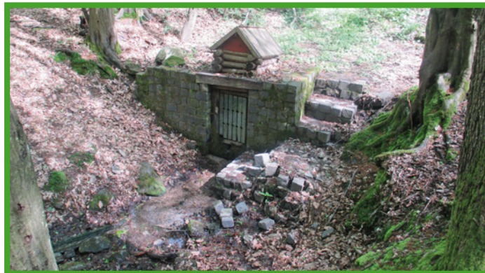
Johanská studnička, N43 27 16.08644, E18 39 19.30934

Bližšie informácie k výzve vám budú poskytnuté na Mestskom úrade v Novej Bani na 1. poschodí, č. dverí 7, prípadne na telefónnom čísle 045/ 6782 806.