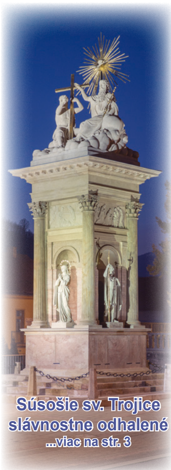
Súsošie sv. Trojice slávnostne odhalené ...viac na str. 3