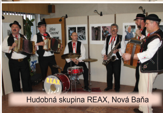
Hudobná skupina REAX, Nová Baňa