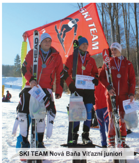
SKI TEAM Nová Baňa Víťazní junióri