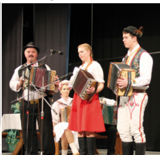
Škvarkovci, Nová Baňa, Bukovina