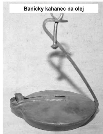
Banický kahanec na olej