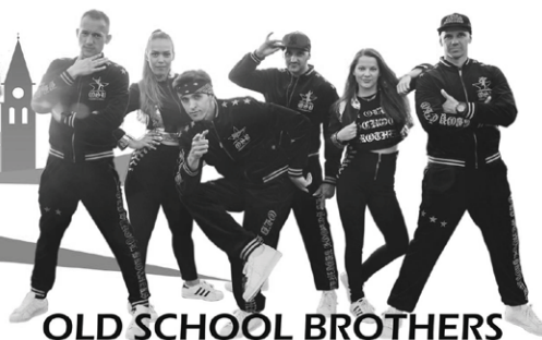
OLD SCHOOL BROTHERS

BOHATÝ PROGRAM A TRADIČNÝ JARMOK info na: www.zarnovica.sk