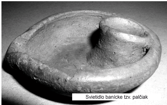
Svietidlo banícke tzv. palčiak

D ejiny mesta Nová Baňa sú, ako všetci vieme, úzko spojené s baníctvom a drahými kovmi. V novobanskom rudnom revíri prebiehala ťažba s väčšími či menšími úspechmi viac ako 500 rokov. V roku 2017 si pripomíname 130. výročie oficiálneho ukončenia banskej ťažby v Novej Bani Výnosom uhorského ministerstva financií č. 27 869/1887 zo dňa 17. mája 1887. Nasledujúce články budú teda venované práve baníctvu.