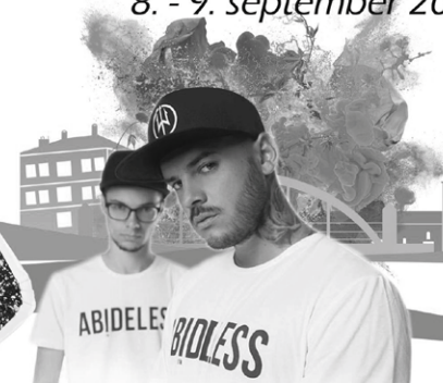
MAJSELF & GRIZZLY

BOHATÝ PROGRAM A TRADIČNÝ JARMOK info na: www.zarnovica.sk