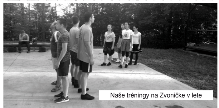
Naše tréningy na Zvoničke v lete