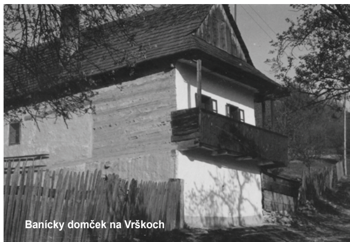
Banický domček na Vrškoch

Situáciu v polovici 17. storočia opisuje aj správa komorského úradníka Petza. Ako príčiny úpadku uviedol stratu rudných žíl, nedostatok vodnej energie, zlú údržbu baní a vnútorné nepokoje v Uhorsku. Navrhoval vybudovať jarky pre vodu z Hrona a postaviť tri stupy. Zaujímavý je jeho návrh prepojiť Reissenschuch a Althandel, čo by znamenalo prerazenie smerom k