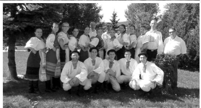
Háj a kapela Gold orchestra v Malej Lehote