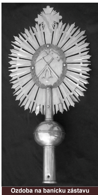
Ozdoba na banícku zástavu

Hronu a obnovenie ťažby drahých kovov. Celá prevádzka by závisela od dostatku vodnej energie.