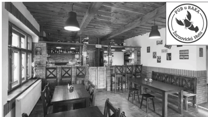
PUB U RAKA Žarnovická Huta