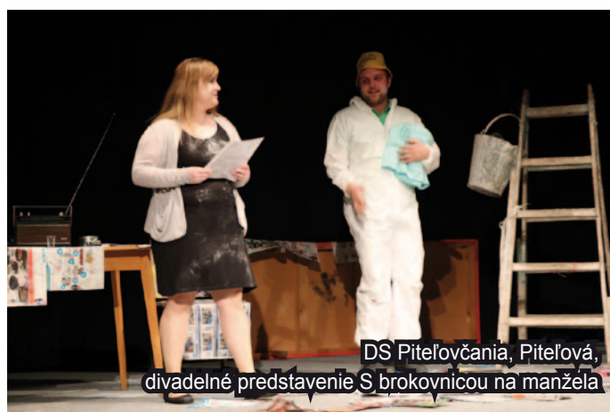
DS Piteľovčania, Piteľová, divadelné predstavenie S brokovnicou na manžela