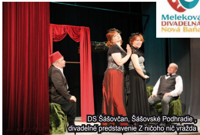
DS Šášovčan, Šášovské Podhradie, divadelné predstavenie Z ničoho nič vražda