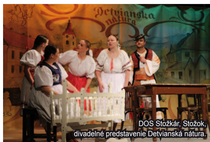
DOS Stožkár, Stožok, divadelné predstavenie Detvianská nátura.