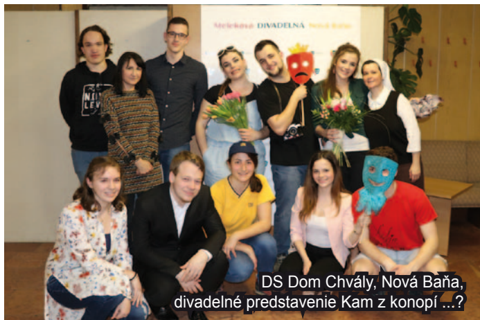
DS Dom Chvály, Nová Baňa, divadelné predstavenie Kam z konopí ...?