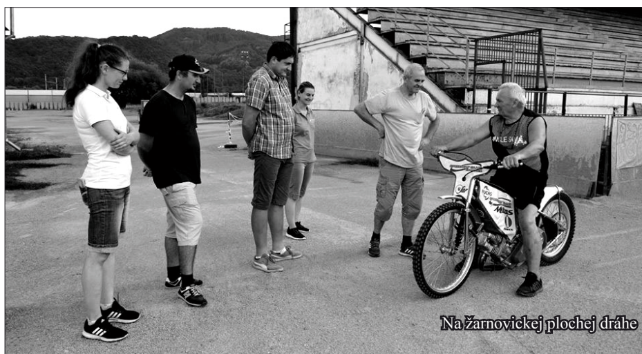
Na žarnovickkej plochej dráhe