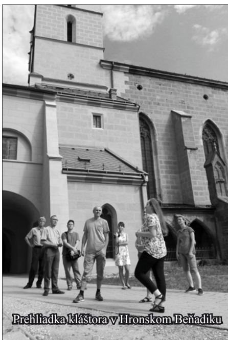
Prehliadka kláštora v Hronskom Beňadiku