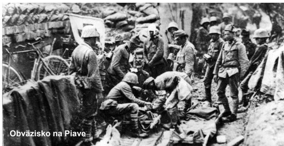
Obväzisko na Piave