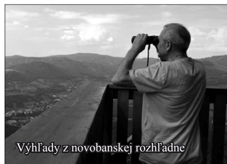
Výhľady z novobanskej rozhľadne

Diecézne múzeum Nitra a spolu sme nazreli do chrámu aj do obnovených častí bývalej sýpky. Tá po rekonštrukcii dýcha nielen históriou, ale čoskoro sa rozozvučí komornými koncertmi a pribudnúť majú aj expozície. Pred poludním sme sa vybrali na novú rozhľadňu na Háji nad Novou Baňou a následne k Tajchu. Našou poslednou zastávkou bola vlajková loď Žarnovica, tamojšia plochá dráha, jediná na Slovensku.