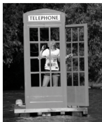
ročníku Splavu netradičných plavidiel na Hrone.