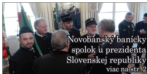
Novobanský banícky spolok u prezidenta Slovenskej republiky viac na str. 2