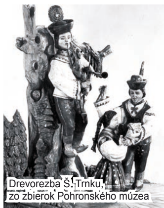
Drevorezba Š. Trnku, zo zbierok Pohronského múzea

Na území Slovenska máme neprevapivo široký výskyt rôznych, miestami veľmi unikátnych hudobných ľudových nástrojov. Jedným z nich sú gajdy, používané hlavne v pastierskej kultúre k spevu i tancu.