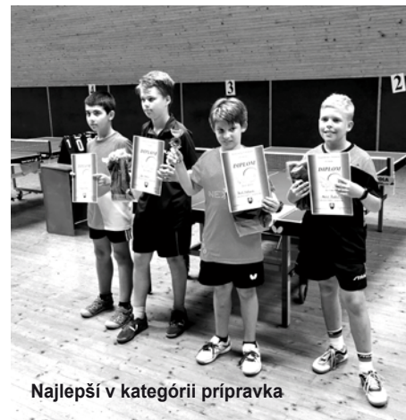
Najlepší v kategórii prípravka