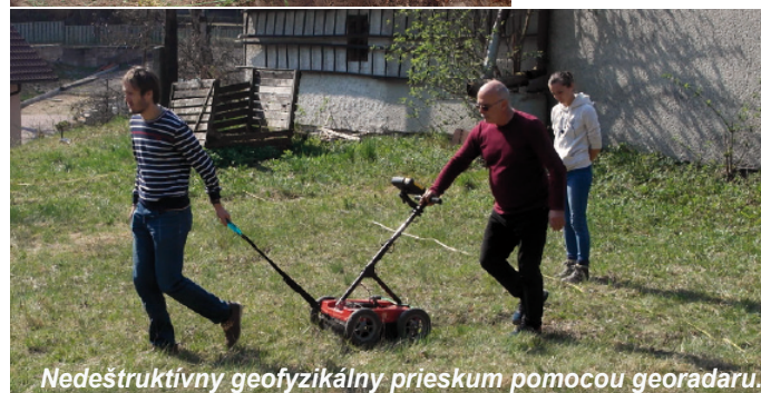
Nedeštruktívny geofyzikálny prieskum pomocou georadaru.

Styk, Phd., skúma, fotí, dokladuje, archivuje. Čas na cigaretku. Bože, kde sú tie oblaky!