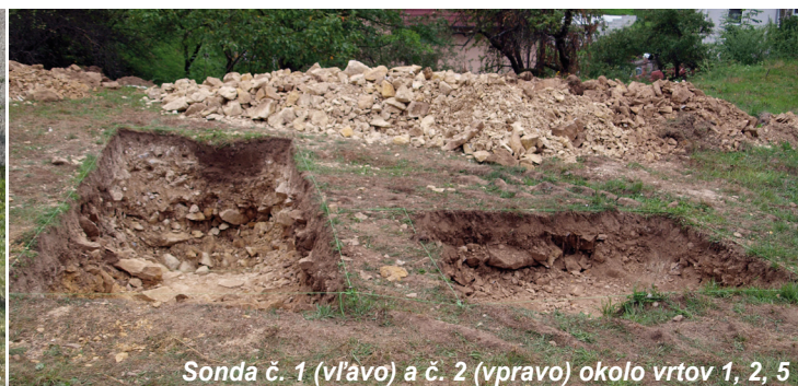
Sonda č. 1 (vľavo) a č. 2 (vpravo) okolo vrtov 1, 2, 5