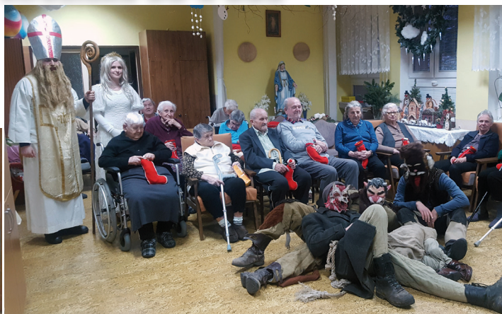
zamestnancov a žiakov ZŠ Jána Zemana Nová Baňa, ZŠ sv. Alžbety Nová Baňa a MŠ Nová Baňa. Zároveň ďakujeme za mikulášske balíčky spotrebnému družstvu