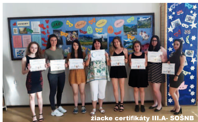
žiacke certifikáty III.A- SOŠNB

recept na koláč sv. Jána, ktorý sa pečie v Španielsku 24. júna. Je to kysnutý sladký koláč ozdobený orieškami a čerešňami a nechýba v žiadnej domácnosti.