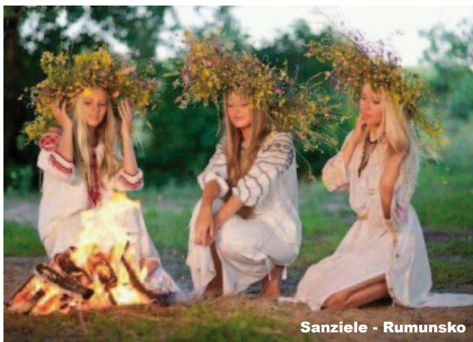
Sanzienele - Rumunsko