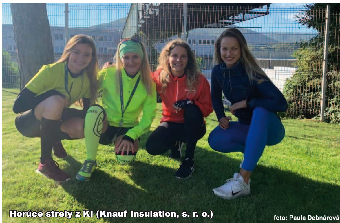
Horúce strely z KI (Knauf Insulation, s. r. o.)