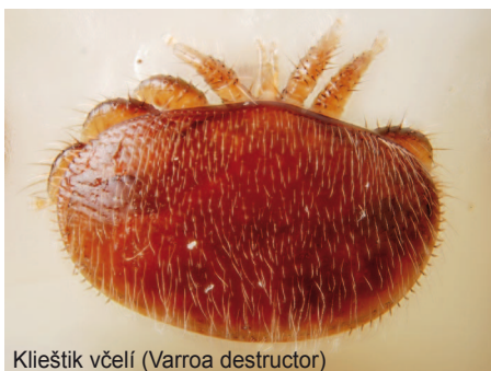
Klieštik včelí ( Varroa destructor )