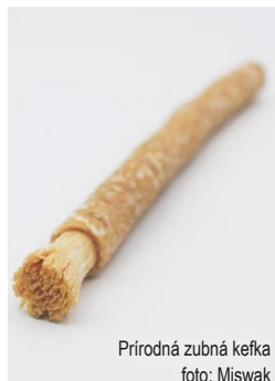
Prírodná zubná kefka foto: Miswak

V súčasnosti už existuje mnoho odporúčaní, ako dosiahnuť zdravé zuby, ktorých by sme sa mali držať, a mali by sme byť vďační za to, že máme k dispozícii mäkké zubné kefy a zubné pasty obsahujúce látky podporujúce zdravie zubov.