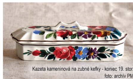
Kazeta kameninová na zubné kefy - koniec 19. stor.

Zatiaľ čo vývoj zubnej pasty zastal, vývoj zubnej kefy stále napredoval. V 30. rokoch 20. storočia bol vynájdený nylon. Vyrábali sa z neho nielen pančuchové nohavice, ale postupne aj štetiny do zubných kefiiek. Mali však hneď niekoľko nevýhod, ako napríklad,