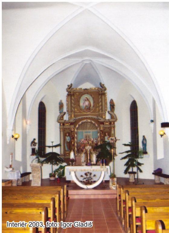
Interiér 2003

Hlavný oltár bol v priebehu storočí menený a dopĺňaný. Architektúra oltára pochádza z prelomu 17. a 18. storočia. Jeho najstaršia časť je však reliéfná polychrómovaná (farbená) drevorezba z konca 16. storočia zobrazujúca poslednú večeru. Ďalšie sochy boli doplnené v 20. storočí: v nadstavci obraz Ježiša ako dobrého pastiera, po stranách sochy svätých Petra a Pavla. Patrónka kostola, svätá Alžbeta, je znázornená na rozmernej olejomalbe z roku 1893, ktorá je zavesená na severnej stene.