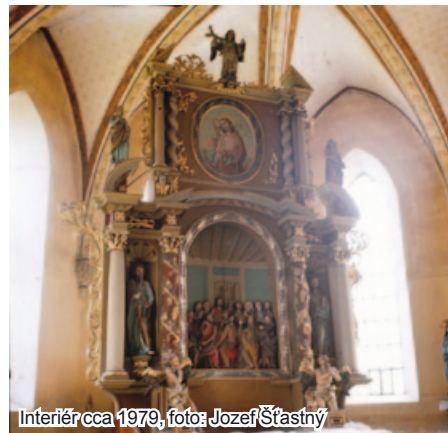
Interiér cca 1979

Keď mesto v roku 1664 dobyli Turci, kostolík stratil svoj účel. Turci barbarsky zničili gotické časti kostola, porozbíjali vytesané rebrá a konzoly klenby. Sekerami zničili aj tesané rebrá gotických oblôk. V dôsledku toho dnes už nemáme ani tušená, aké figurálne motívy boli použité. Potom kostol premenili na mešitu.