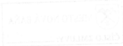
tabuľka č. 1